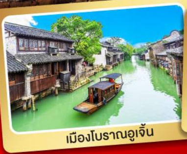
เมืองโบราณอูเจิ้น