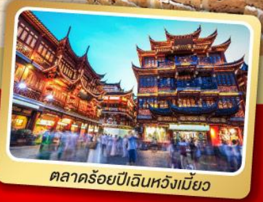
ตลาดร้อยปีฉินหวงเหมียว