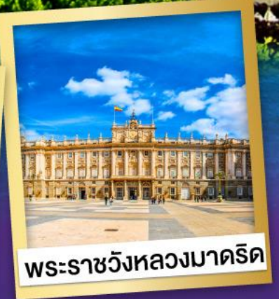
พระราชวังหลวงมาดริด