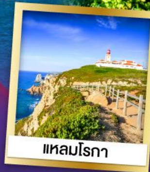
แหลมโรกา