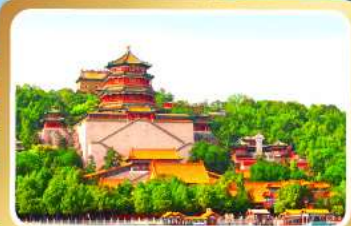
พระราชวังฤดูร้อนอ้อเหอหยวน