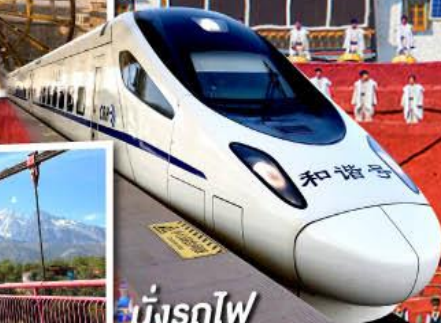
นั่งรถไฟ ความเร็วสูง