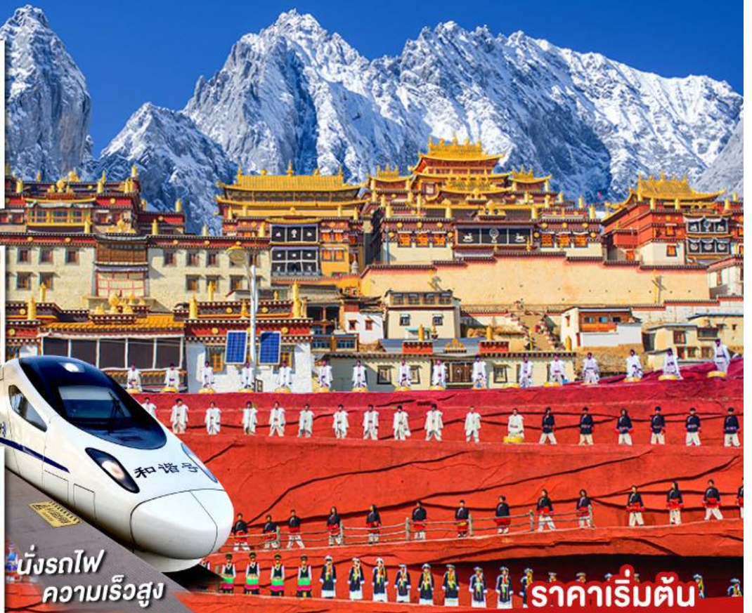
นั่งรถไฟ ความเร็วสูง