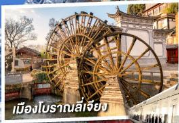
เมืองโบราณลี่เจียง