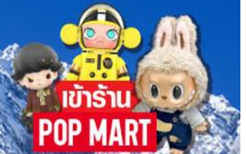
เข้าร้าน POP MART