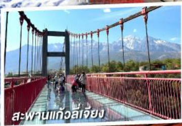
สะพานแก้วลี่เจียง