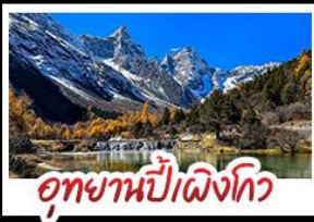
อุทยานป่าเผิงโกว

อุทยานสัตว์ป่า - อุทยานป่าเผิงโกว - อุทยานจิวจ้ายโกว รถไฟความเร็วสูง - EASTERN SUBURB MEMORY ถนนโบราณความจำ - วัดต้าซือ ช้อปปิ้งย่านคิง ถนนไท่กู่หลี่ + ถนนซุนซีลู่