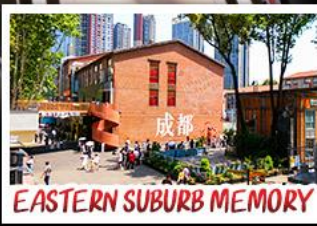
EASTERN SUBURB MEMORY