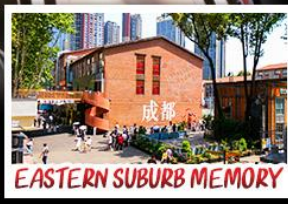
EASTERN SUBURB MEMORY