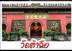
วัดต้าซือ