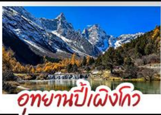
อุทยานป่าเผิงโกว

อุทยานสี่ดรุณี - อุทยานป่าเผิงโกว - อุทยานจิวจ้ายโกว รถไฟความเร็วสูง - EASTERN SUBURB MEMORY ถนนโบราณความจำย - วัดต้าฉือ ช้อปปิ้งย่านคิง ถนนไท่กู่หลี่ + ถนนชุนซีลู่