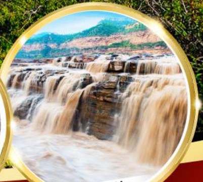
น้ำตกหูโง่ว