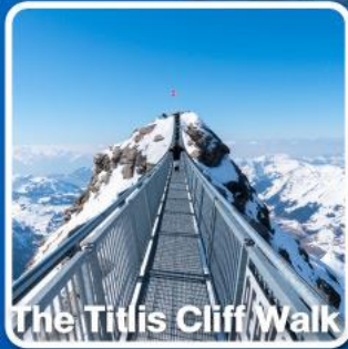
The Tittlis Cliff Walk