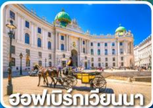
ฮอฟบวร์กเวียนนา