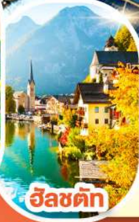
อินส์บรอก