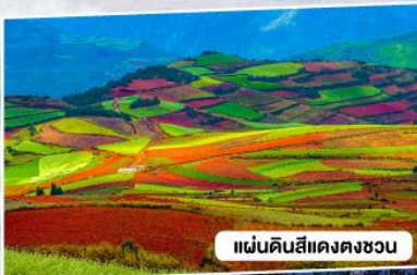
แผ่นดินสีแฉ่งตงชวน