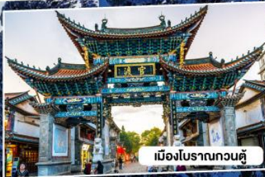
เมืองโบราณกวนตุ๋