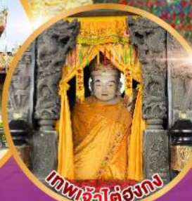
เทพเจ้าไต่ตองกง