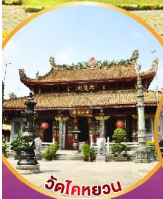
วัดโคกหยวน