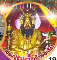
เซียงบูชัว (ศาลเจ้าพ่อเอ็ง)