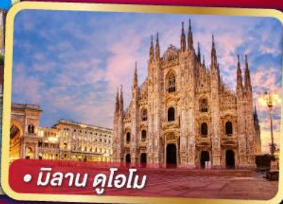
• มิลาน คูโอโม