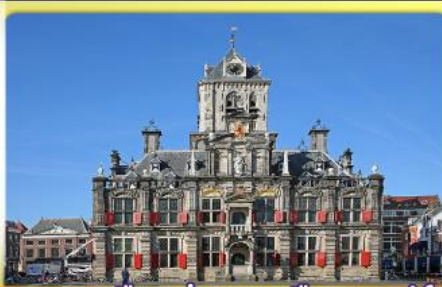
อาคารเมืองเก่าคลองเมืองเคลฟท์