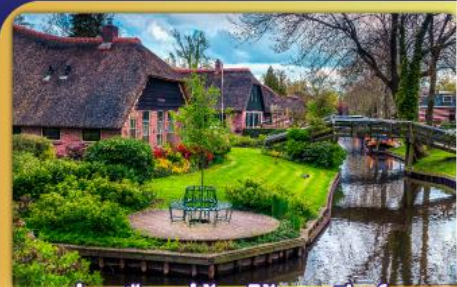
ล่องเรือหมู่บ้านไรทอนทีธูร์น