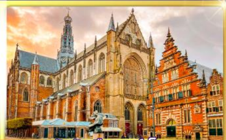
จัตุรัสเมืองฮาร์เล็ม

พรมแดนเมืองแปลกเนเธอร์แลนด์และเบลเยียม เดินเมืองเคลฟท์ เมืองเครื่องปั้นดินเผาระดับโลก ฮาร์เล็มเมืองมั่งคั่งที่สุดของเนเธอร์แลนด์