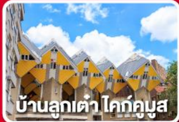
บ้านลูกเต๋า โคกคูมูส

เยือนเมืองแปลกดินแดน 2 ประเทศ บาร์-นัสซา บาร์-เฮิร์ตโท