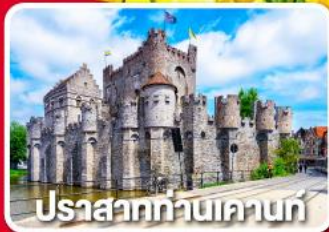
ปราสาทท่านเคานท์