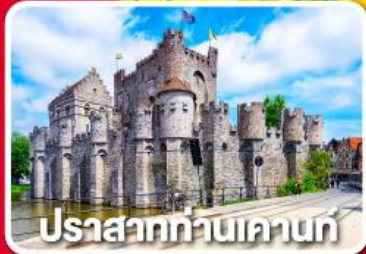
ปราสาททำนเคานท์