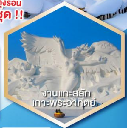
งานแกะสลัก เกาะพระอาทิตย์