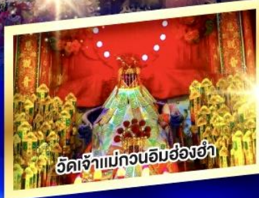
วัดเจ้าแม่กวนอิมฮ่องอ๋า