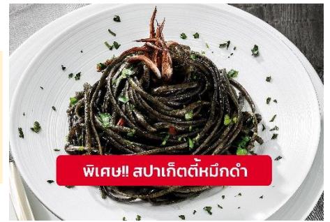
พิเศษ!! สปาเก็ตตี้หมีกด้า

Highlight ! เมื่อเยือนเกาะเวนิส เมนูที่ขึ้นชื่อและหากได้มาต้องได้ลิ้มลอง สปาเก็ตตี้ผัดซอสหมีกด้าที่คลุกเคล้ากับความหอมนุ่มนวลกับบรรยากาศ สุดคลาสสิคฉบับอิตาเลียนต้นตำรับเวนิส