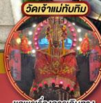
ขอพรเรื่องการเดินทาง เปิดป่าความเชื่อริยา