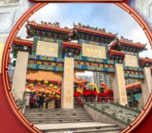
ขอพรด้านสุขภาพ