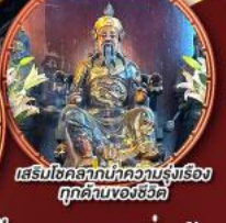
เสริมโชคลาภนำความรุ่งเรือง ทุกด้านของชีวิต