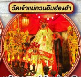
นมัสการองค์เจ้าแม่กวนอิม ที่มีอายุกว่า 600 ปี