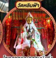
โชคลาภและความมั่งคั่ง