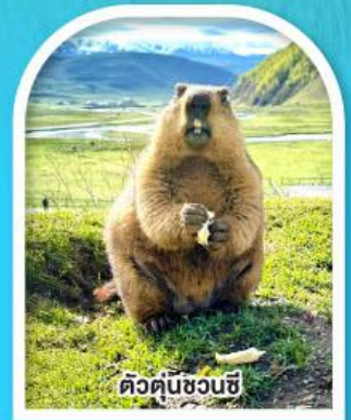
ตัวคุณชวนซี