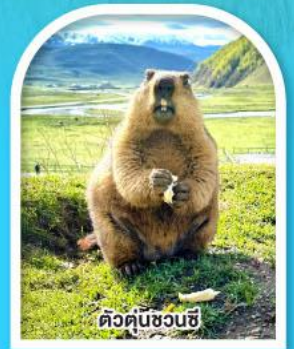
ตัวต๊นซวนซี