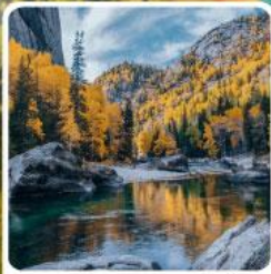
เคอเคอทัวไห่