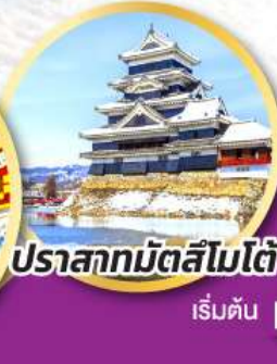
ปราสาทมัตสึโมโตะ