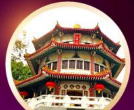
วัดหวนหวน