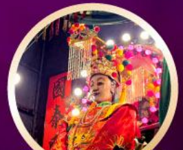
วัดเจ้าแม่กิมกิมทิว