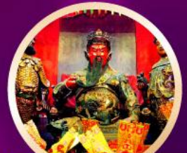
วัดกวนไท เทพเจ้ากวนอู