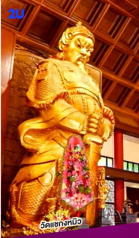
วัดแขกหมิว

Email : info@qetour.com Website : https://qetour.com