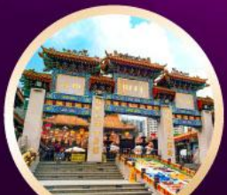
วัดหวังคำเซียน