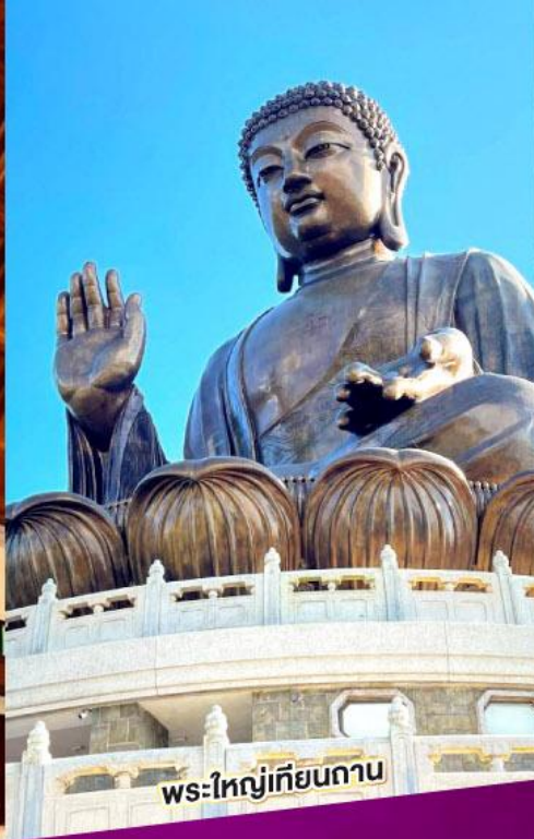
พระใหญ่เทียนกาน