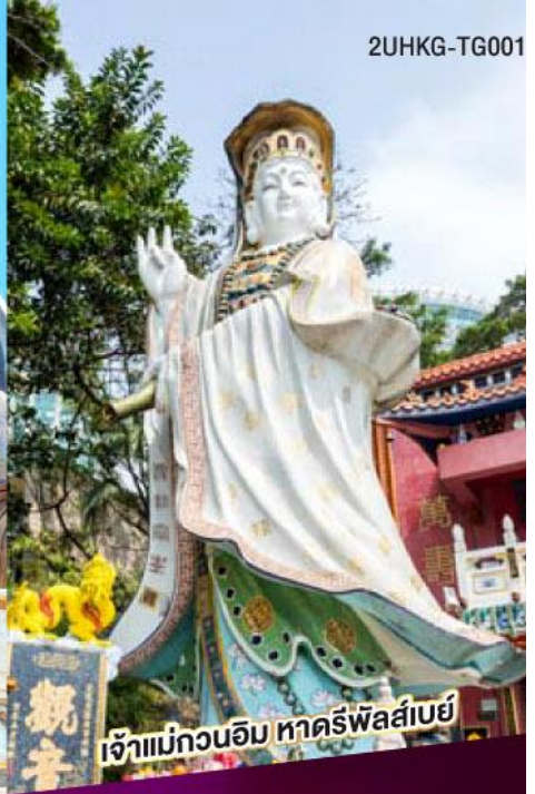
เจ้าแม่กวนอิม ทาครีฟลัสบี