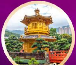
สวนหนานเหลียน วัดนางชีหลิน