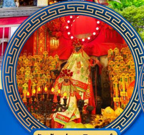
วัดเจ้าแม่กวนอิมของฮ่า