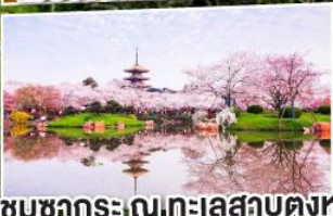
ชมซากุระ ณ ทะเลสาบตงหู