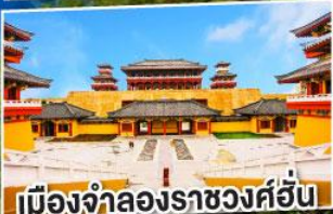
เมืองจำลองราชวงศ์ฮั่น