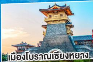
เมืองโบราณเชียงหยาง