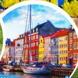
ท่าเรือฮาวน์.โตเปนเฮเกน