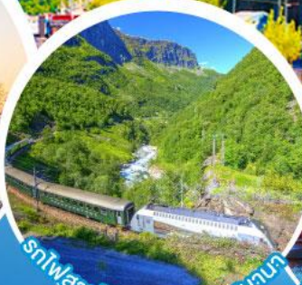
รถไฟสายโรเมนติกฟลัมสบานา