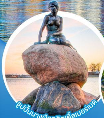
รูปปั้นนางเงือกลิตเติลเมอร์เมด