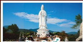
วัดเข็กินอึ้ง