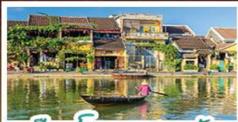
เมืองโบราณเฮืองอัน

! พบกับเขานาฮิลล์ 1 คืน ! สัมผัสอากาศเขตร้อนชื้นตลอดปี สโตร์ฝรั่งเศสสุดคลาสสิก - นั่งกระเช้ายาวที่สุด สูบานาฮิลล์ สนุกสุดมันส์ไปกับสวนสนุก The Fantasy Park นมัสการเจ้าแม่กวนอิมองค์ใหญ่ที่สุดของเมืองดานัง - ศึกษามืองมรดกโลกฮอยอัน - สนุกสนานไปกับกิจกรรม!!นั่งเรือกระดิง หมู่บ้านกัมกาน เช็กอินร้านกาแฟ SON TRA MARINA CAFE - ไม่ลงร้านช้อปปิ้ง - อิ่มอร่อยกับบุฟเฟ่ต์นานาชาติ , หม้อไฟซีฟู้ด