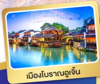
เมืองโบราณอูเจิน