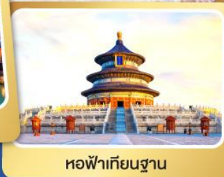
หอฟ้าเทียนชาน