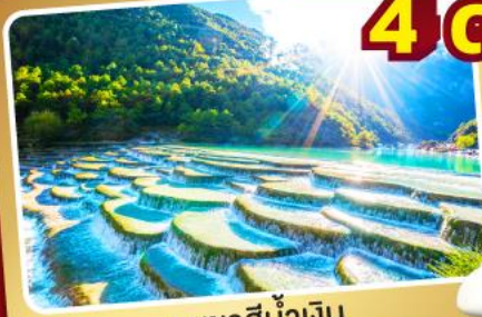
หุบเขาน้ำเงิน