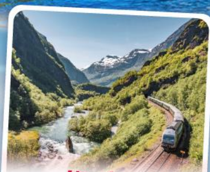
พหลิมส์บานา รถไฟเส้นทางสายโรแมนติก