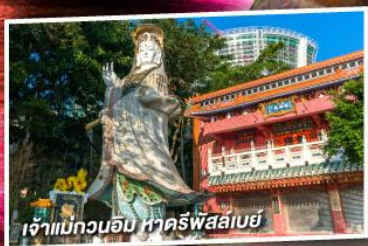
เจ้าแม่กวนอิม หาดริฟส์เลย์