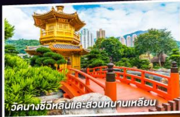
วัดนางชีอิหลินและสวนหนานเหลียน