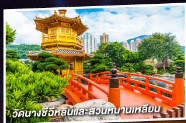
วัดนางชีอิหลินและสวนหนานเหลียน