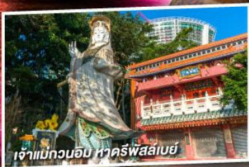
เจ้าแม่กวนอิม หาดริฟส์เลย์