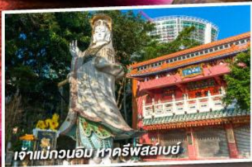
เจ้าแม่กวนอิม หาดริฟส์เลย์