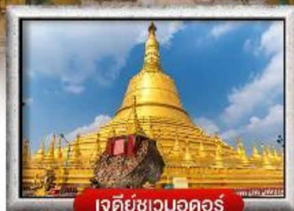
เจดีย์ชเวดากอง

เมนู สุดพิเศษ | กุ้งแม่น้ำเผา + บุฟเฟ่ต์นานาชาติ