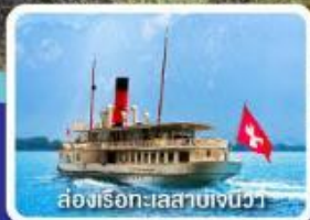
ล่องเรือทะเลสาบเจนีวา