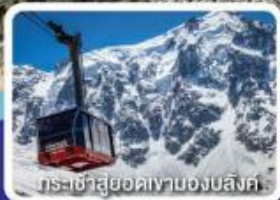
กระเช้าสู่ยอดเขาองบลังค์