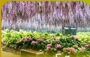
สวนนกเปาเม็ย