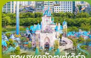
สวนสนุกโลกอเตเวอริล Lotte Adventure World