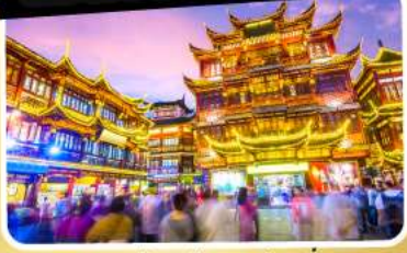
ตลาดร้อยปีเฉิงหวงเมี่ยว