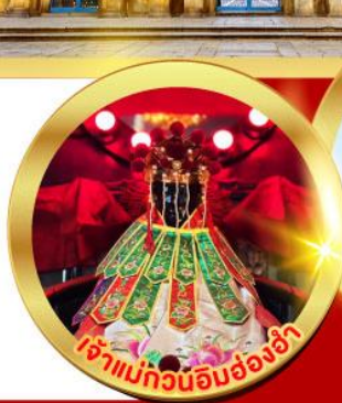
เจ้าแม่ทวนอิมฮ่องกง