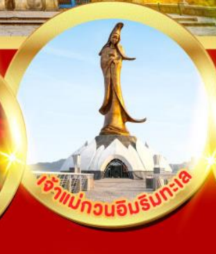
เจ้าแม่ทวนอิมริบทะเล