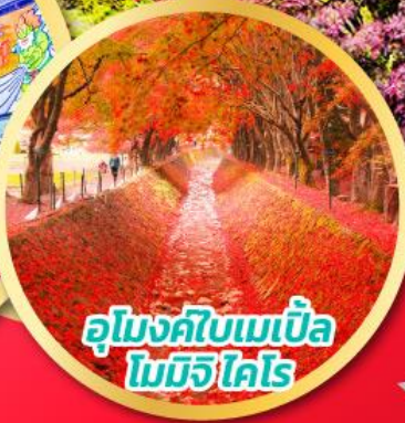
อุโมงค์ใบเมเปิ้ล โมมิจิ โคโร

อิสระช้อปปิ้งโอซาก้า ชมดอกซากุระพร้อมใบไม้เปลี่ยนสี ณ โอบาระ ชมใบไม้เปลี่ยนสีหุบเขาโคโรังเค