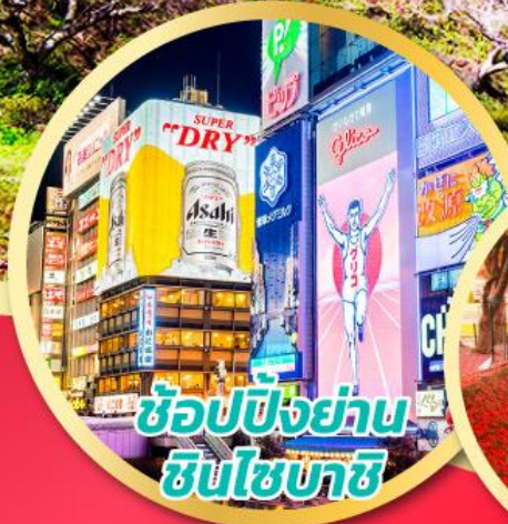
ช้อปปิ้งย่าน ชินจูกุ