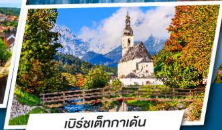
เบิร์ชเต็กกาเดิน