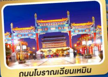
ถนนโบราณเฉียนเหมิน