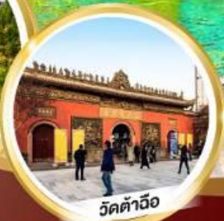
วัดต้าฉือ