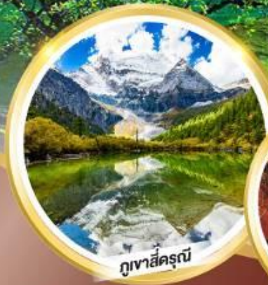
ภูเขาสี่ดรุณี