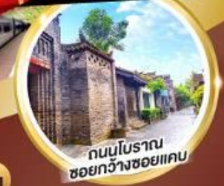
ถนนโบราณ ชอยกว้างชอยแคบ