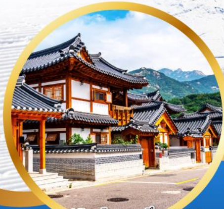
หมู่บ้านโบราณอินพยอง