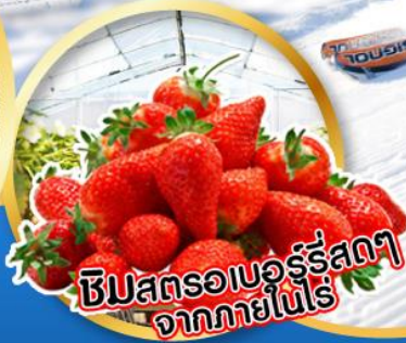
ชิมสตรอเบอร์รี่สดๆ จากภายในไร่