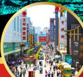
ถนนซุนซีลู่

ห้องพัก 4 ดาว ไม่เข้าร้านช้อปปิ้ง!! -เมนูพิเศษ สุกีหมาล่าเสว่น , เปิดบักกิ้ง