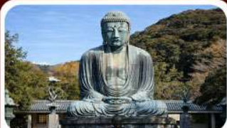
หลวงพ่อดาโอบุตซึ