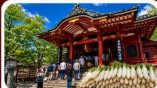
วัดมิตสึจิยามะโซเด็น