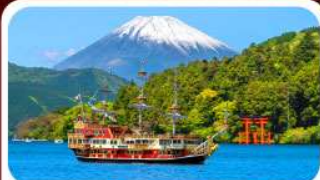
ล่องเรือทะเลสาบอาชิ

28 ส.ค.-02 ก.ย.69 18-23, 23-28 ก.ย.69 04-09, 11-16 ก.ย.69 24-29, 25-30 ก.ย.69 16-21, 17-22 ก.ย.69 30 ก.ย.-05 ต.ค.69