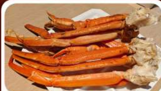
บุฟเฟ่ต์งาปู