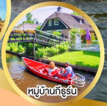
หมู่บ้านก็ร์รูน