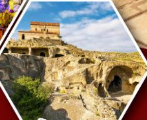
เมืองถ้ำอพลิสตซ์เคห์