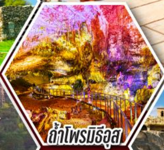
ถ้ำไฟรมีริอุส