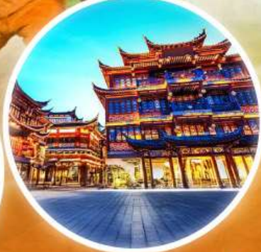
ตลาดร้อยปีเจิ้งหังเมี่ยว