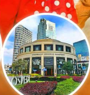
Starbucks ใหญ่ที่สุดในโลก