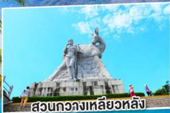
สวนทิวเขาเหลียวหลิง