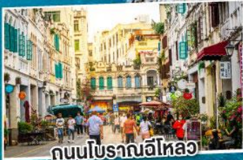
ถนนโบราณอีโหลว