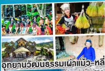
อุทยานวัฒนธรรมเผ่าแม้ว-หลี่