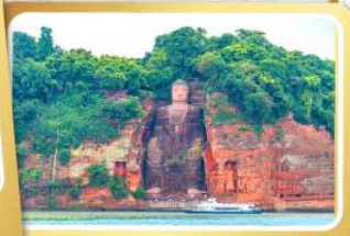
ล่องเรือชมหลวงพ่อดิลเฉิงชาน