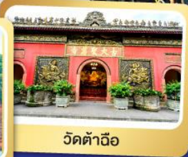
วัดต้าอ้อ