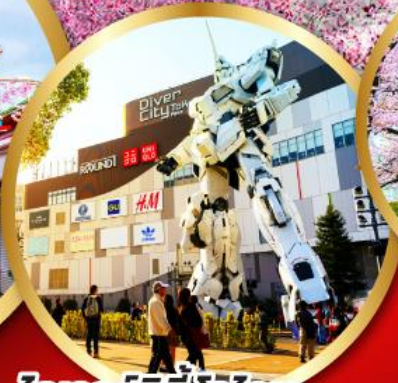
โตเวอร์ซิตี ไอโดบะ