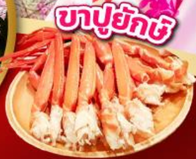
ชาบูยักษ์