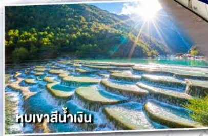
หุบเขาสีน้ำเงิน