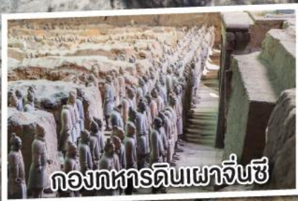
กองทัพดินเผาซีอาน