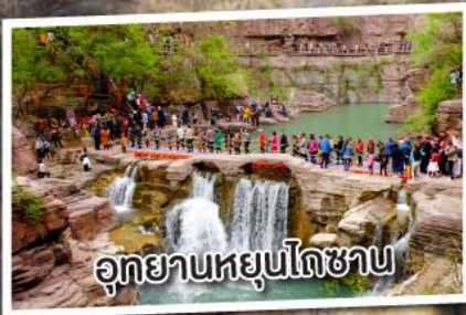
อุทยานหยุนโกซาน