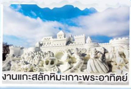
งานแกะสลักหิมะเกาะพระอาทิตย์