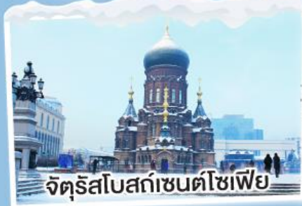
จัตุรัสโบสถ์เซนต์โซเฟีย