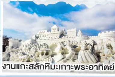
งานแกะสลักหิมะเกาะพระอาทิตย์