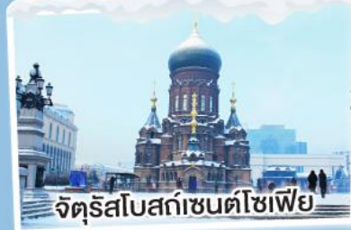
จัตุรัสโบสถ์เซ็นต์โซเฟีย